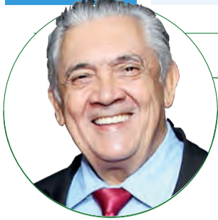
■ HD Hércules Dias blog:www.herculesdias.com.br