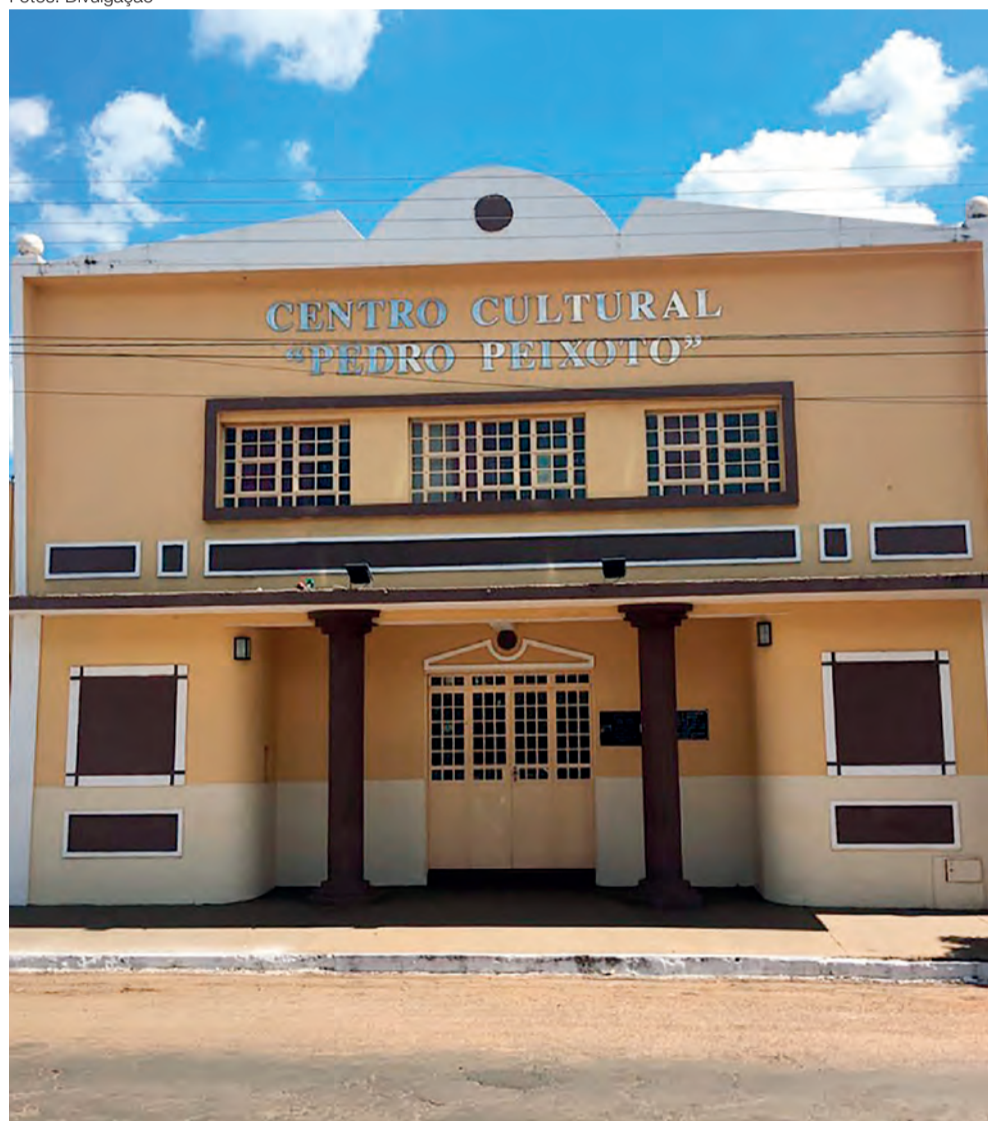
Centro Cultural Pedro Peixoto, Nova Veneza