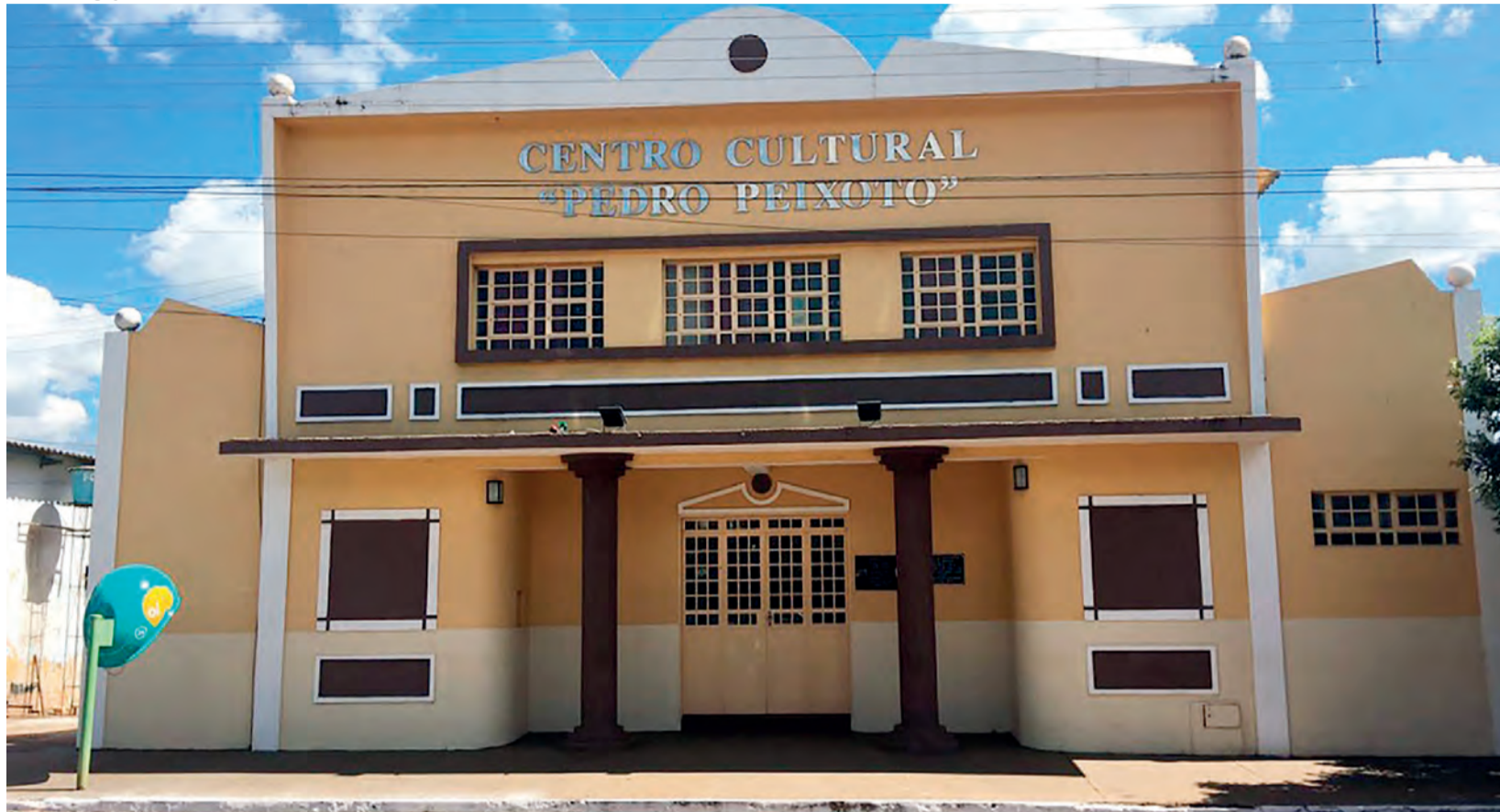
Centro Cultural Pedro Peixoto, Nova Veneza