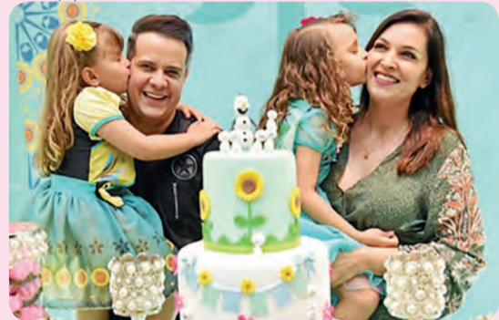
Equipe Núcleo Astúcia