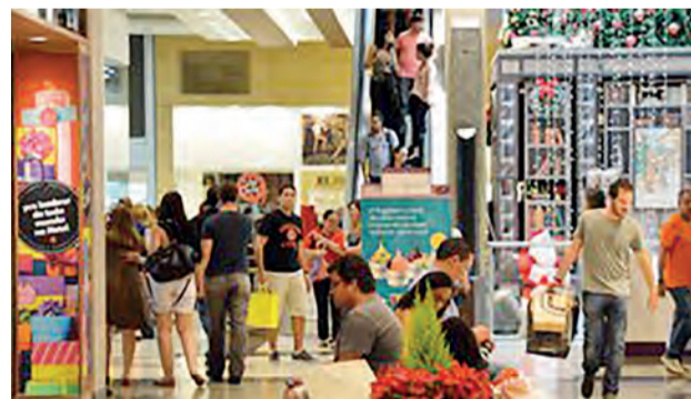
Shopping no centro de Brasília tem movimento intenso no último fim de semana antes do Natal

De acordo com o secretário, os empregados que trabalharem aos domingos e feriados terão folgas