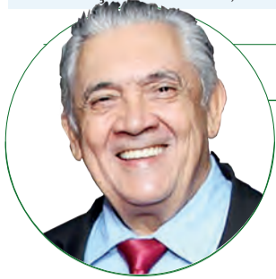
■ HD Hércules Dias blog:www.herculesdias.com.br