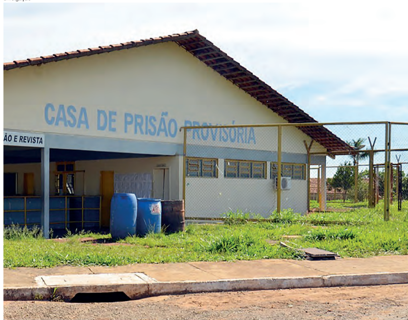
Casa de Prisão Provisória no Complexo Prisional de Aparecida de Goiânia PÁGINA 03