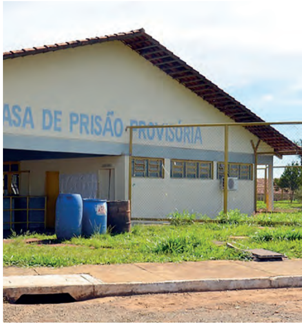
Casa de Prisão Provisória no Complexo Prisional de Aparecida de Goiânia

MP-GO - Acolhendo parcialmente pedidos do Ministério Público de Goiás (MP-GO), a juíza Zilmeni Gomide Manzolli proibiu o Estado de receber novos presos na Casa de Prisão Provisória (CPP) do Complexo Prisional de Aparecida de Goiânia, até a abertura de novas vagas. Ela também determinou a reserva de 50%, desde a propositura da ação, em 17 de junho, na Conta Única do Tesouro Estadual, na parcela destinada para o Fundo Especial do Sistema Prisional de Execução Penal. Por fim, ordenou que a as obras de ampliação da CPP tenham início no prazo de 180 dias, sob pena de multa de R$ 10 mil.