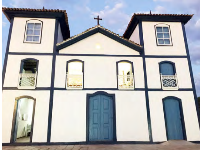
Igreja do Bonfim: bem material tombado pelo Iphan