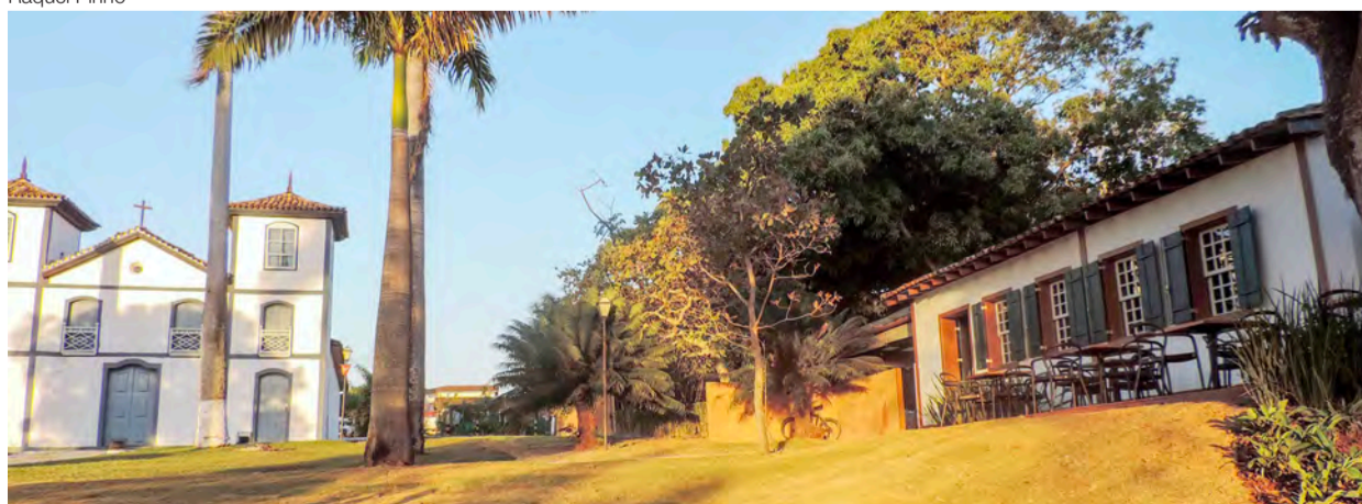
Igreja do Bonfim e Divino Lounge Café: patrimônios tombados pelo Iphan