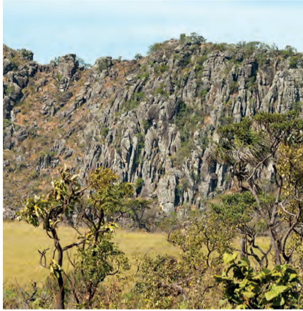
Parque dos Pireneus

LUIZ FERNANDO RODRIGUES - Hoje, 17 de agosto, data em que comemoramos o Dia Nacional do Patrimônio Histórico, vale lembrar que história e cultura são riquezas inestimáveis de um povo e dizem muito sobre como uma dada população lida e aprende com sua própria trajetória e costumes. Neste quesito, podemos dizer que Pirenópolis está muito bem servida com a preservação de patrimônios que resgatam a história da cidade desde o período colonial.