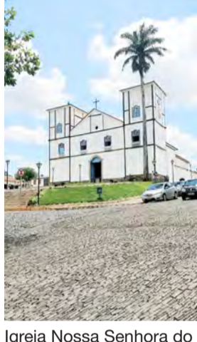
Igreja Nossa Senhora do Rosário