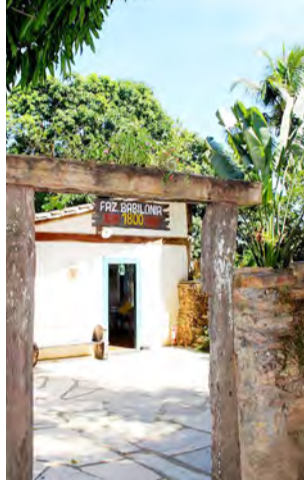
Fazenda Babilônia