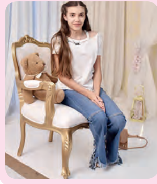
Álbum de família