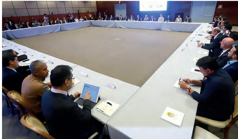
Programa “Pioneiros Pátria Amada” pretende atender inicialmente 25 mil jovens

O governador do Estado do Tocantins, Mauro Carlesse, cumpre agenda oficial em Belém-PA na segunda-feira, 2, a convite do Governo Federal e do governador do Pará, Helder Barbalho, para uma nova reunião, agora com cinco ministros de Estado, para discutir o combate aos incêndios, o desmatamento ilegal e também alternativas de desenvolvimento sustentável na Amazônia Legal.