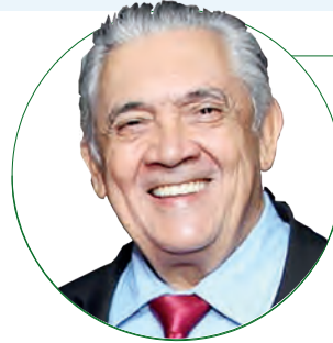
■ HD Hércules Dias www.herculesdias.com.br