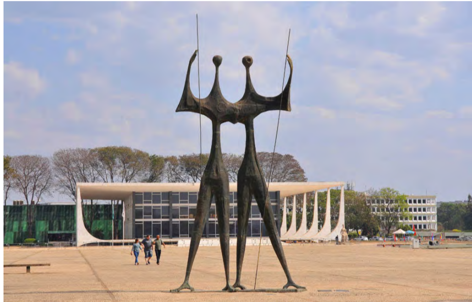
Os Guerreiros na Praça dos Três Poderes. Obra é popularmente conhecida como Os Candangos, um símbolo da cidade

ANA LUIZA VINHOTE, DA AGÊNCIA BRASÍLIA - Reconhecida como Patrimônio Cultural da Humanidade pela Organização das Nações Unidas para a Educação, a Ciência e a Cultura (Unesco), Brasília chama a atenção de moradores e turistas pelos conjuntos arquitetônicos. Entre eles, monumentos, edifícios e esculturas. As obras do artista Bruno Giorgi, por exemplo, são símbolos da capital.