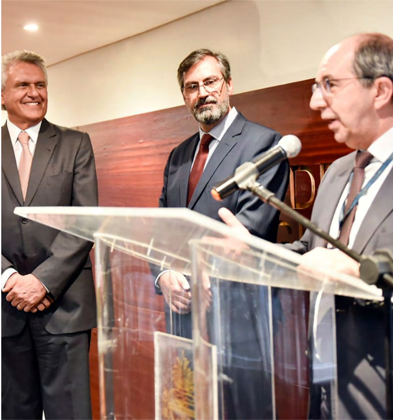
Almoço com promotores e procuradores