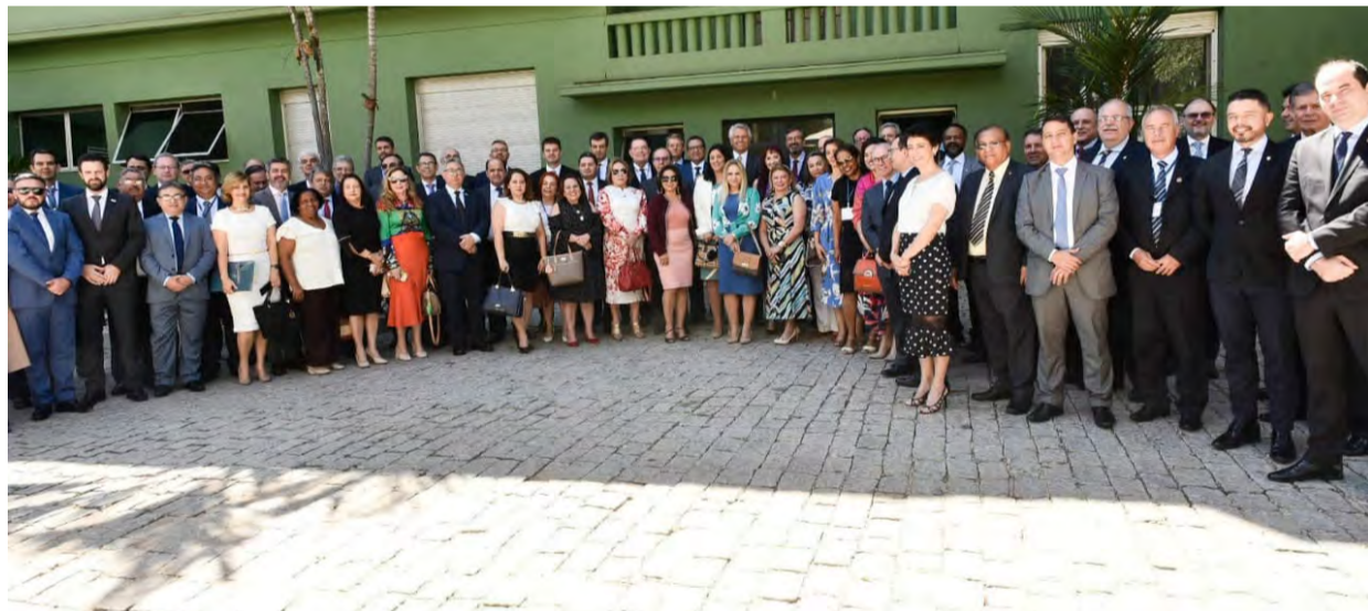
Almoço com promotores e procuradores