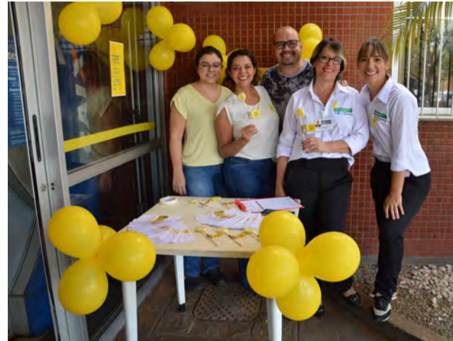
Equipe do Huapa durante a ação do Setembro Amarelo

O setor de Psicologia do Hospital Estadual de Urgências de Aparecida de Goiânia Cairo Louzada (Huapa) promoveu no último dia 10 de setembro (terça-feira), ação em lembrança ao “Setembro Amarelo”, mês lembrado pela campanha em prevenção ao suicídio. Com balões e lacinhos na cor característica, os organizadores entregaram panfletos com dicas de como reconhecer os sinais de alerta em pessoas que estão ao nosso redor e que precisam de ajuda.