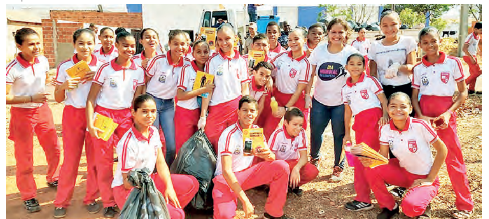
Estudantes atenderam o chamado realizando limpeza em algumas quadras no entorno da Escola, no Setor Lago Sul

O Colégio Esportivo Militar do Corpo de Bombeiros Professora Margarida Lemos Gonçalves (Cemil), no Setor Lago Sul, em Palmas, participou ativamente do Dia Mundial da Limpeza Urbana, celebrado no domingo 22. Contudo, a ação da instituição foi organizada na sexta-feira, 20, com cerca de 200 estudantes.