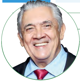
■ HD Hércules Dias www.herculesdias.com.br