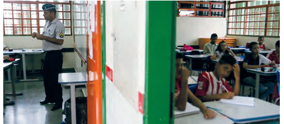
Modelo cívico-militar implantado em escola pública do Distrito Federal

AGÊNCIA BRASIL - De acordo com o Ministério da Educação (MEC), as escolas devem manifestar interesse junto à secretaria estadual de Educação. Serão selecionadas duas instituições de cada estado e do Distrito Federal. Para participar da seleção, os colégios devem ter de 500 a 1 mil alunos do 6º ao 9º ano do ensino fundamental ou do ensino médio.