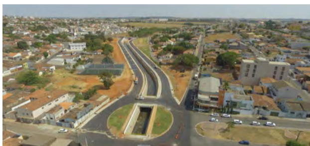
A novas etapa de canalização do Córrego Pirapitinga, uma obra de R$20 milhões, será inaugurada hoje

Com a presença do governador Ronaldo Caiado, o prefeito Adib Elias, de Catalão, inaugura, nesta sexta-feira, 27, às 20 horas, mais uma etapa da canalização do Córrego Pirapitinga, a maior obra de infraestrutura realizada no interior do Estado. Foram investidos ali mais de R$20 milhões, recursos oriundos do Ministério de Desenvolvimento Regional.