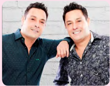
Platina Line / MF Press Global

■ LOJA ROSA - Segue até o dia 31, no Estação da Moda Shopping um espaço montado em parceria com a Associação dos Portadores de Câncer de Mama, que está comercializando artesanatos para arrecadação de fundos e oficina sobre uso de lenços e turbantes.