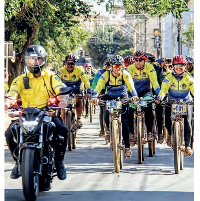
Passeio Ciclístico reunirá mais de 200 pessoas

Neste próximo domingo (27) as ruas de Anápolis irão ganhar um colorido especial com um passeio que deve reunir mais de 200 pessoas, entre adultos e crianças. Com camisas estampadas nas cores rosa e azul, os ciclistas irão pedalar em favor da campanha Outubro Rosa, que promove a conscientização sobre a prevenção contra o câncer de mama. A concentração será a partir das 6 da manhã, no estande do Gran Life Medical Complex, que fica na Avenida Goiás, Setor Central. A saída do passeio está prevista para às 07 horas, o percurso terá 20 quilômetros, passando pelas principais avenidas da cidade, pelo Parque Ipiranga, com parada na Unidade Oncológica do Hospital do Câncer em Anápolis, onde os participantes irão dar um abraço simbólico na unidade hospitalar, retornando ao local da partida.