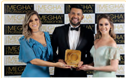
Programa aqui em casa

■ SUGESTÃO DE NOTAS: LEOARRU@GMAIL.COM ■ WATSAPP: (62) 98438-2554 ■ INSTAGRAM: @LEONARDOARRUDA