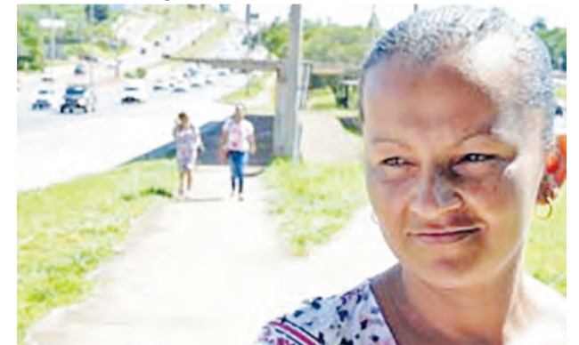
Erenice: rápido e seguro

Os ônibus com portas dos dois lados começaram a circular nesta segunda-feira (13) no corredor exclusivo da EPTG – e, a partir de agora, durante todos os dias da semana. A medida agradou os usuários.