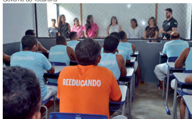
Aulas serão ofertadas para duas turmas que somarão 20 alunos com acesso a 13 disciplinas

A unidade prisional finalizou, em agosto de 2019, a construção de uma sala de aula de 25 metros quadrados, que possui ventilação, quadro e 20 carteiras para acolher os alunos. Trata-se