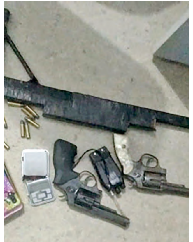
Forças policiais deflagram operação em Miranorte e prendem quatro suspeitos por tráfico de drogas