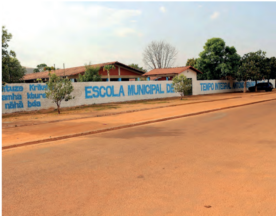
Escola Municipal de Tempo Integral Antônio Benvindo da Luz

A Prefeitura de Tocantínia ampliou, nessa terça-feira (05), a suspensão das aulas na rede municipal para o dia 29 de maio devido à pandemia do coronavírus no país.