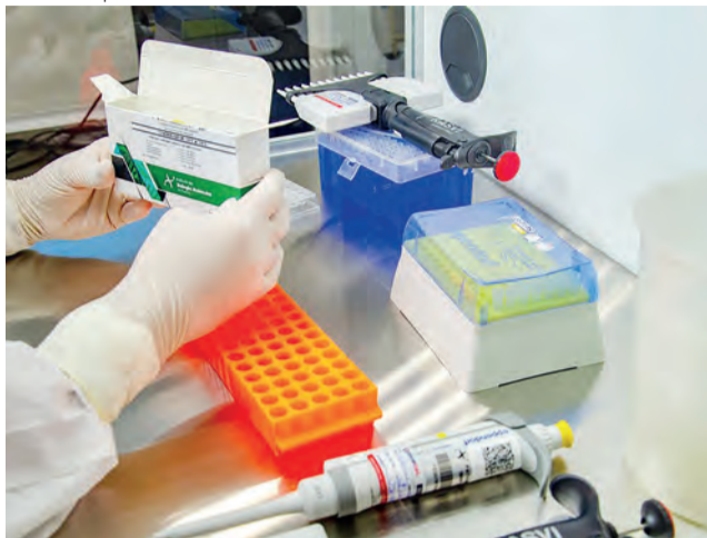
Estudo pode incluir até 60 mil voluntários, sendo 7 mil no Brasil

Os dados que embasaram a autorização incluíram estudos não clínicos e dados não clínicos e clínicos acumulados de outras vacinas