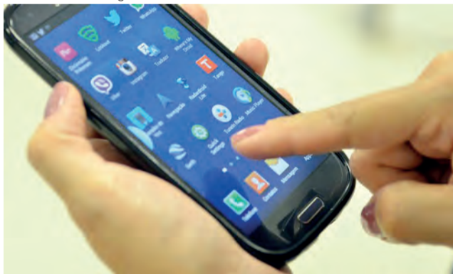
O cadastramento pode ser feito pelo site da ANTT

O Registro Nacional de Transportadores Rodoviários de Cargas (RNTRC) agora pode ser feito de forma 100% digital. A medida implementada pelo Ministério da Infraestrutura, por meio da Agência Nacional de Transportes Terrestres (ANTT), tem o objetivo de desburocratizar e simplificar o cadastro, bem como aprimorar a eficiência no transporte de cargas do país.