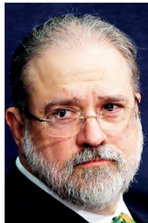
Procurador-Geral da República testou hoje positivo para covid-19

Depois de 5 autoridades confirmarem que estão com covid-19, após a posse do ministro Fux na presidência do STF na última quinta-feira, 10, agora foi a vez do procurador-geral da República Augusto Aras testar positivo para o coronavírus.