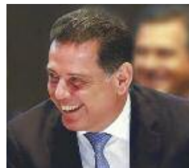
Sorriso contagiante do governador Marconi Perillo, com prestígio político em todo o país