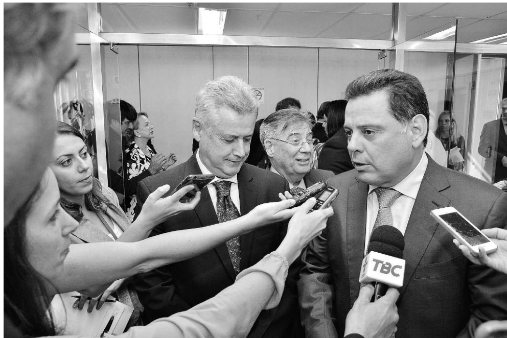
Governadores de Goiás e do Distrito Federal discutem parcerias.

A primeira pauta tratou da construção de uma linha férrea para trem de média velocidade entre Brasília e Goiânia, integrando as duas regiões. "A nossa ideia é