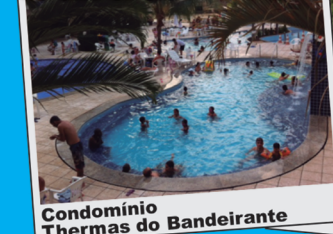
Condomínio Thermas do Bandeirante