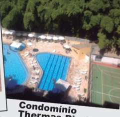
Condomínio Thermas Rio Caldas