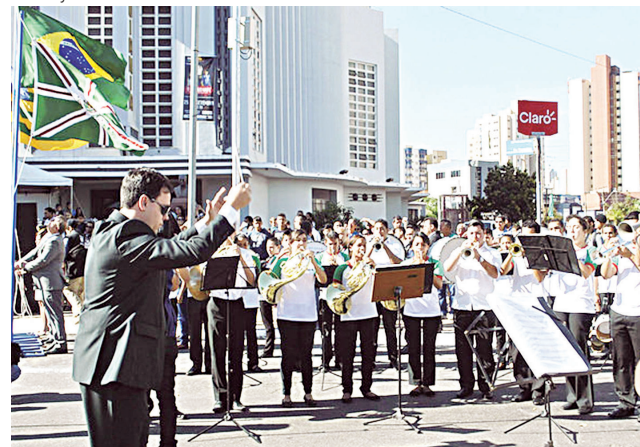
Banda Marcial de Goiânia fará a execução do Hino Nacional

do Estado de Goiás, que pela primeira vez participa do desfile, fechando com a Guarda Civil Metropolitana de Goiânia (GCM). Neste desfile, as corporações trazem não só seus efetivos como também equipamen-