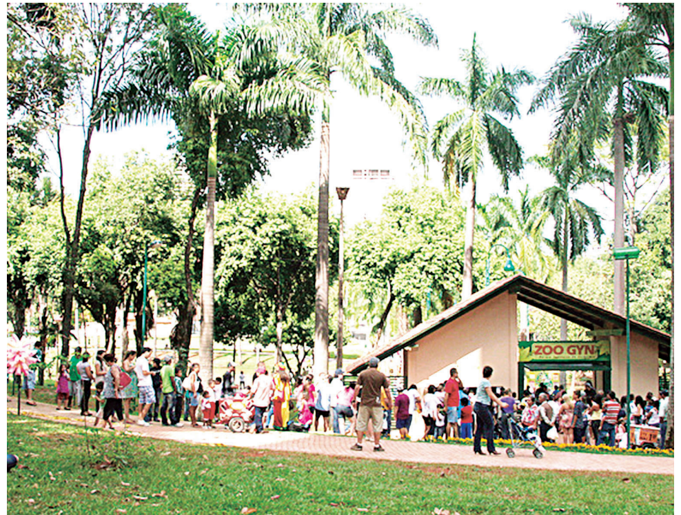
3ª Feira Socioambiental com o tema: “Cerrado e a preservação desse bioma”