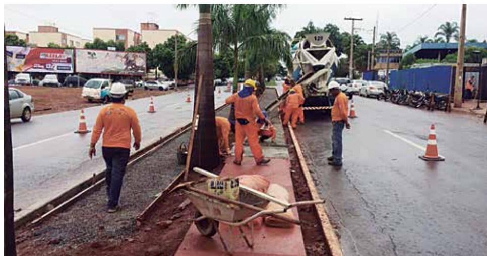
Ciclovias é executada e faz parte do corredor preferência de ônibus T-7