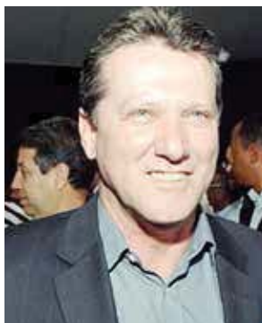
Vecci - PSDB