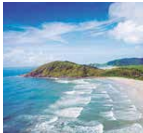
Ilha do Mel