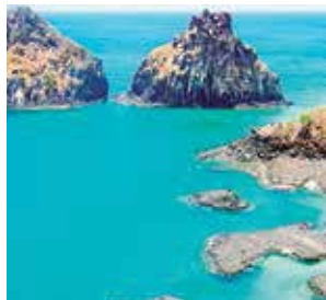
Baía do Sancho