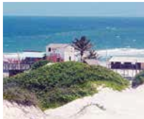
Princesa, na Ilha de Algodóal