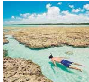
Vilarejo de Milagres

DA REDAÇÃO - No Pará, no Norte, a praia da Princesa, na Ilha de Algodóal, é uma boa pedida para quem gosta de locais rústicos e exóticos. Para ter acesso ao cenário bucólico que envolve o longo caminho até a praia, o visitante deve gostar de aventura para desfrutar do percurso cercado por uma enseada com dunas.