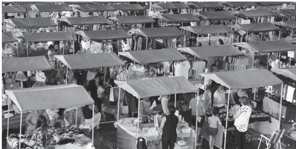
Feira de Talentos acontece, até o dia 03/12, entre 7h e 13h, no Paço Municipal