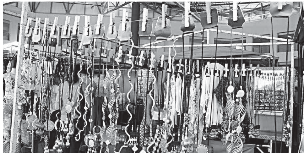
Iniciativa mostra aptidões artísticas, culinárias ou de vestuário dos servidores públicos

DA REDAÇÃO COM SECOM - Quem passou nesta terça-feira, 1º, pelo Hall de Convivência do Paço Municipal surpreendeu-se com a quantidade de pessoas e bancas entre os mais diversos produtos: de comidas típicas, a roupas e artesanatos. Nesta semana, a Prefeitura de Goiânia, por meio da Secretaria Municipal de Administração (Semad), promove a Feira de Talentos - Edição Natalina 2015. O evento, que vai até a próxima quinta-feira,