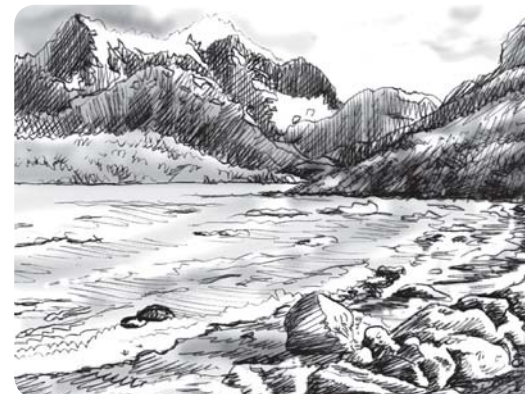
ILUSTRAÇÃO: NEIL LIMA

Que tal fazer um CRUZEIRO pelas gélidas paisagens da PATAGÔNIA Chilena? A viagem começa pela pequena CIDADE de Puerto NATALES , de onde parte o navio SKORPIOS III . A melhor ÉPOCA para fazer esse passeio é durante a PRIMAVERA e o VERÃO , entre os meses de outubro e abril. A grande ATRAÇÃO procurada pelos turistas são os GLACIARES – enormes blocos de GELO que podem ter quilômetros de EXTENSÃO e que se deslocam pelo mar gelado. Os viajantes aguardam ansiosamente no deque do navio pelos ESTRONDOS causados pelo desprendimento de alguns desses BLOCOS . Ao todo, durante o PASSEIO , os passageiros do Skorpios III percorrem cerca de 300 km e avistam dez glaciares. Alguns desses blocos foram formados há mais de 30 mil anos, e os pesquisadores explicam que quanto mais ANTIGO , mais AZUL fica o gelo.