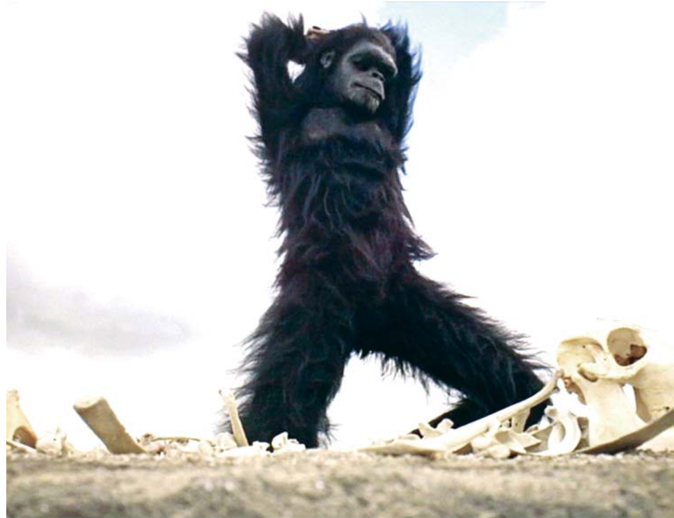
Cena de "2001: Uma Odisseia no Espaço", que faz alusão ao momento em que nossos ancestrais descobriram o poder de matar uns aos outros

A expansão do Homo erectus da África para a Ásia cerca de 1,6 milhões de anos atrás parece ter sido causada pela necessidade de encontrar pastos mais largos. Em