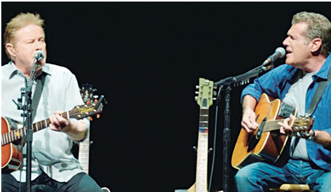
Don Henley (esquerda) e Glenn Frey, da banda The Eagles

Glenn Frey, guitarrista da banda Eagles, morreu aos 67 anos em Nova York, nos Estados Unidos. Ele estava enfrentando problemas intestinais havia meses e, em novembro, passou por uma cirurgia.