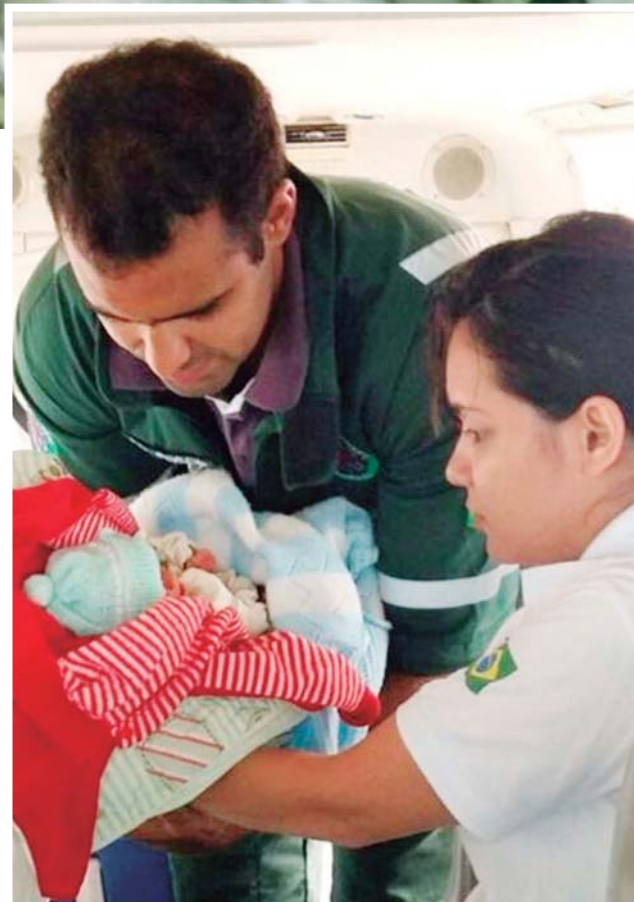
Momento em que o bebê sobrevivente foi transferido de Jutai para Manaus