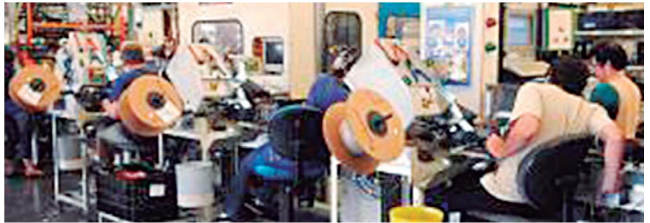
A produção industrial fechou 2015 em queda em 12 dos 15 locais pesquisados pelo Instituto Brasileiro de Geografia e Estatística (IBGE)

A produção industrial fechou 2015 em queda em 12 dos 15 locais pesquisados pelo Instituto Brasileiro de Geografia e Estatística