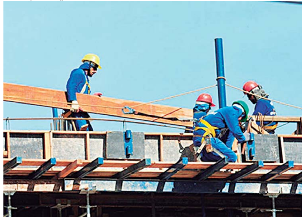
Mercado de trabalho na construção civil do Distrito Federal aumentou 9,5% em fevereiro