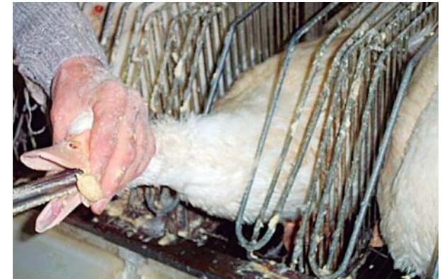
A alimentação forçada do ganso faz com que o seu fígado, usado no Foie Gras, cresça até 10 vezes

A Prefeitura de Goiânia sancionou a Lei 9.818/2016 que proíbe a produção e o comércio de alimentos feitos total ou parcialmente a partir da alimentação forçada de animais. O processo é conhecido por dar origem, entre outros, ao prato francês chamado Foie Gras, que é o fígado de ganso ou pato alimentado de forma forçada até a exaustão.