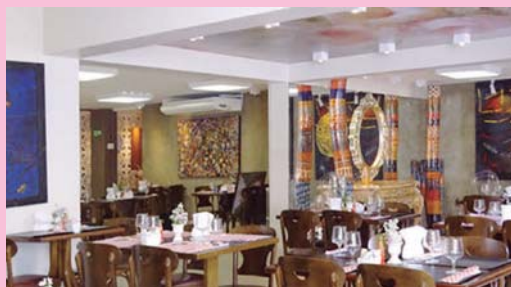
Restaurante Rosas Cozinha e Sentimento mistura arte e boa gastronomia