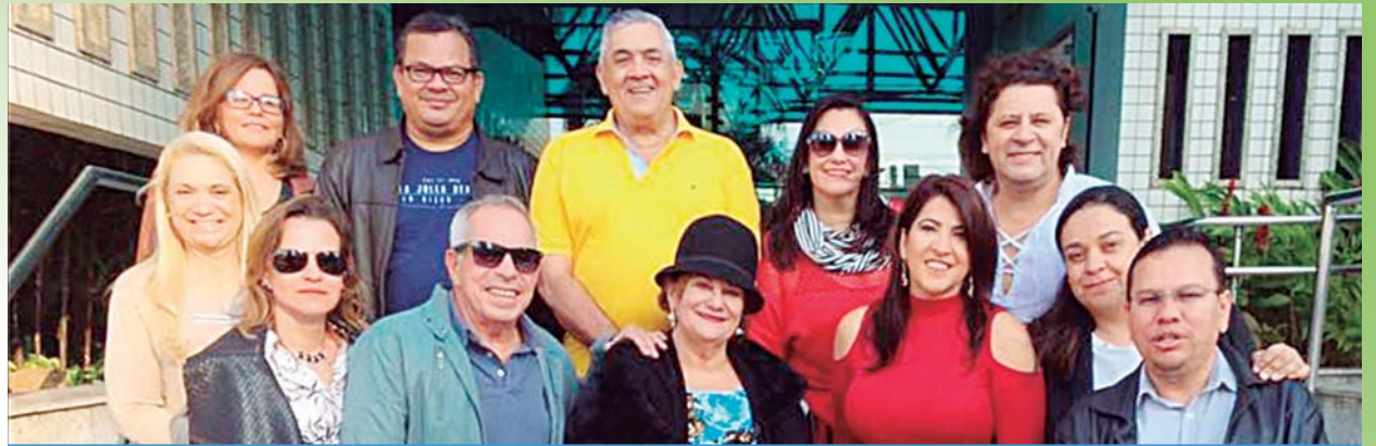
Jornalistas de Goiás, São Paulo, Minas Gerais, Santa Catarina e Mato Grosso do Sul e Paraná, prestigiaram o evento