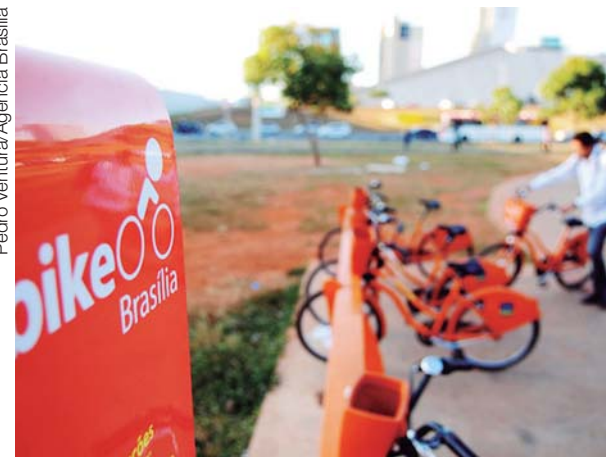
Estação do Bike Brasília próximo à Rodoviária do Plano Piloto