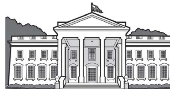
ILUSTRAÇÃO: MÔNICA LIE

Ao contrário do que muitos imaginam, a Casa BRANCA , residência OFICIAL dos PRESIDENTES dos Estados Unidos, não foi sempre branca nem batizada com esse NOME . A construção do PRÉDIO começou em 1792, com PEDRAS e tijolos MARRONS , sendo chamado de PALÁCIO Presidencial. A mudança de nome e de cor aconteceu somente em 1814, quando os INGLESES invadiram a CIDADE de Washington e incendiaram vários prédios oficiais, incluindo o palácio. Depois do DESASTRE , o espaço passou por uma REFORMA e recebeu uma PINTURA branca para ajudar a esconder as MARCAS do ACIDENTE . O novo VISUAL contribuiu para o surgimento do APELIDO , que só foi oficializado em 1902 pelo presidente Theodore Roosevelt. Pelo espaço interno, a CASA não é considerada um verdadeiro palácio: possui 51,2 metros de comprimento por 26,1 metros de largura. Por outro lado, o TERRENO é enorme, com 7,2 HECTARES , o equivalente a sete ESTÁDIOS do MARACANÁ!