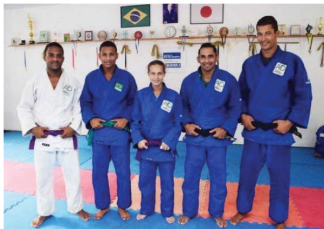
Atletas surdos do judô brasileiro

Depois disso, em 1995, o ICDC, por decisão da maioria dos delegados, decidiu se retirar do IPC. No início deste ano, o Comitê Internacional de Desportos de Surdos e o Comitê Olímpico Internacional assinaram um memorando de reconhecimento com o objetivo de