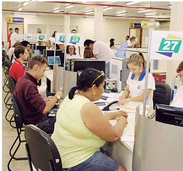
Cerca de 700 atendentes serão treinados