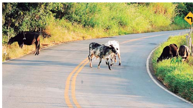
Santa Helena (GO). O juízo de primeiro grau deferiu a indenização, mas o Tribunal Regional do Tra-

A Agência Goiana de Transportes e Obras (Agetop), a Pro Saúde Associação Beneficente de Assistência Social e Hospitalar e o Estado de Goiás foram condenados a pagar indenização por dano moral de R$ 50 mil à viúva e aos filhos de um motorista que morreu em acidente com dois animais bovinos em rodovia, quando transportava um médico de Goiânia para prestar serviço na cidade de