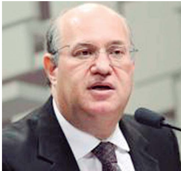
O presidente do Banco Central, Ilan Goldfajn

recurso de acordos bilaterais. O recurso principal do FMI são as quotas. Depois delas, o FMI usa os recursos do NAB.