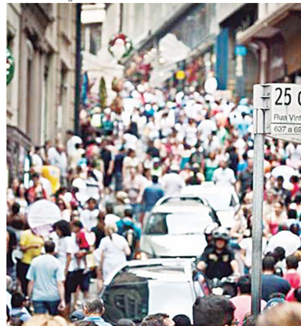
Movimento na Rua 25 de Março, centro de comércio popular de São Paulo, maior cidade da América do Sul

Mais de 90% da população brasileira viverá em cidades no ano de 2030, segundo previsão divulgada nesta segunda-feira (17) pela encarregada nacional do Programa da Organização das Nações Unidas para os Assentamentos Humanos (ONU-Habitat) no Brasil, Rayne Ferretti.