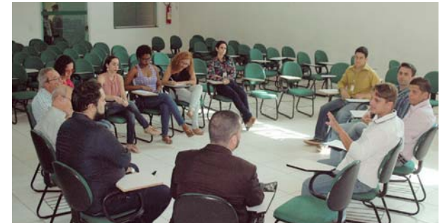
Reunião para formação do conselho de bem-estar animal

A Agência Municipal do Meio Ambiente (Amma) realizou no último dia 11, uma reunião para discutir a criação do Conselho Municipal de Bem-Estar Animal. O intuito é desenvolver medidas de proteção dos animais, tendo em vista que são de responsabilidade pública relativa à saúde e ao meio ambiente. Estavam presentes representantes da Secretaria Municipal de Saúde (SMS), Escola de Veterinária da Universidade Federal de Goiás (UFG), Faculdades Objetivo, Conselho Regional de Medicina Veterinária e Associação Protetora e Amiga dos Animais (Aspaam).