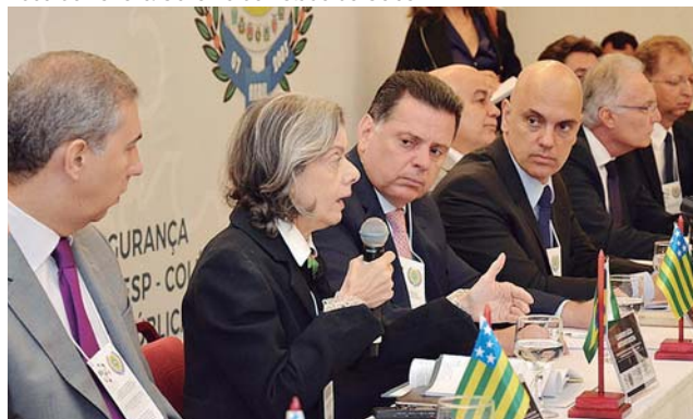
Ministra Cármen Lúcia diz que a violência no país exige mudanças estruturantes

“Darcy Ribeiro fez em 1982 uma conferência dizendo que, se os governadores não construísem escolas, em 20 anos faltaria dinheiro para construir presídios. O fato se