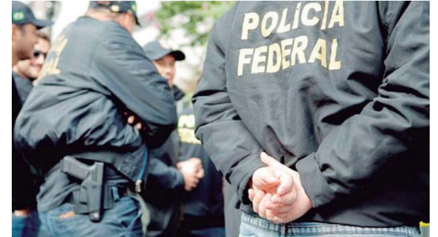
Polícia Federal cumpre mandados e conduções coercitivas em Goiás

A Polícia Federal deflagrou no último dia 11 a segunda fase da Operação Sexto Mandamento para desarticular um grupo de extermínio atuante no estado de Goiás. A primeira fase da operação foi deflagrada em 2011 e tinha como alvo uma organização criminosa com poder de influência e de intimidação composta por policiais militares do estado, das mais diversas patentes.