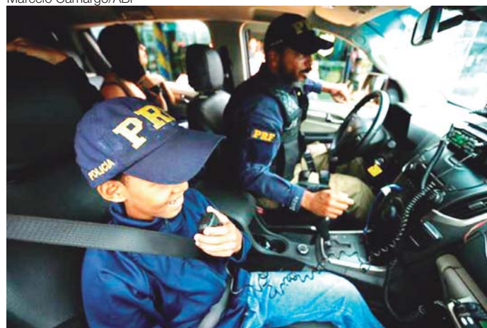
Crianças com câncer e suas famílias visitam a PRF durante ação para lembrar o Dia Nacional de Combate ao Câncer