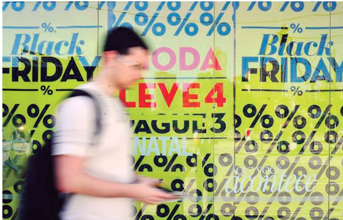
Anúncio de promoções e vantagens da Black Friday movimentou comércio paulista

ma, para chegar no dia da promoção e baixar. É uma maquiagem de preço que nós, consumidores, devemos boicotar e denunciar aos Procons para evitar ‘o tudo pela metade do dobro’”, afirmou a diretora.