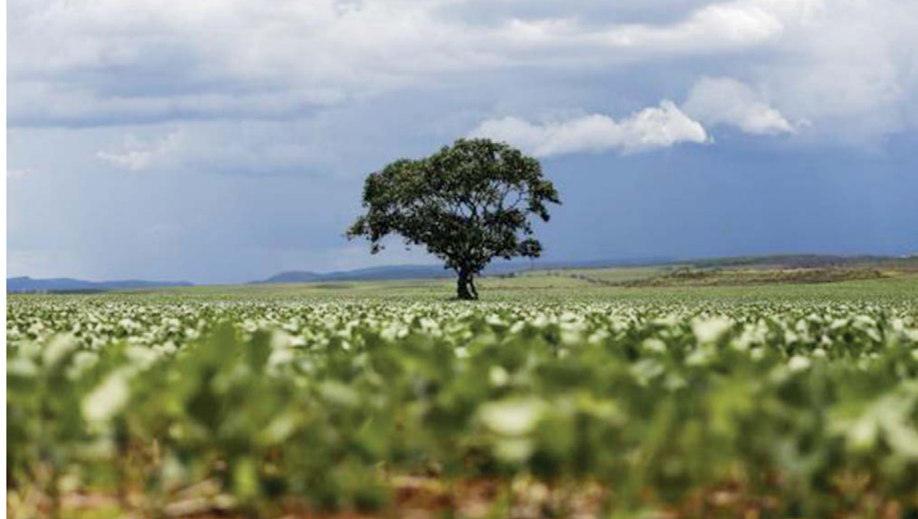
Plantação de soja em área do município de Alto Paraíso mostra o avanço da fronteira agrícola na região da Chapada dos Veadeiros