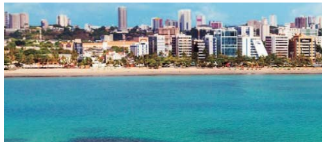
Piscinas naturais em Pajuçara, em Maceió