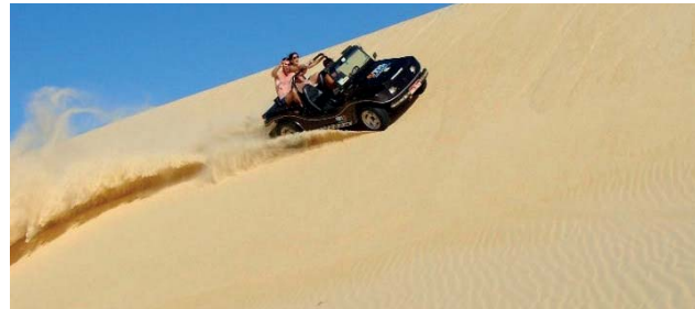
Natal - Passeio de bug pode ser com ou sem emoção

Maceió: Localizada no Nordeste, a capital de Alagoas tem as praias urbanas mais bonitas da região, com destaque para Pajuçara, Jatiúca e Ponta Verde. As piscinas naturais dão um charme especial às praias, emolduradas por coqueirais que contrastam com a marcante areia branca. Os vários tons de verde e azul impressionam os seus visitantes e atraem