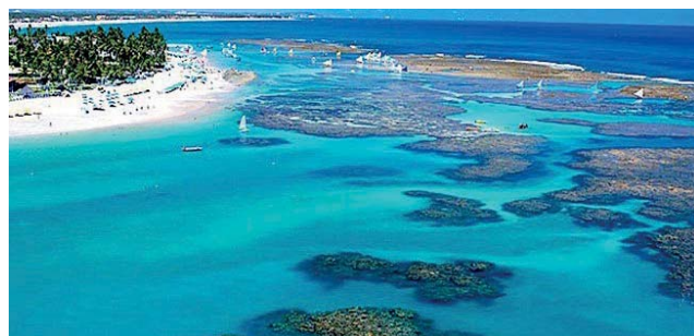
As piscinas naturais em Porto de Galinhas