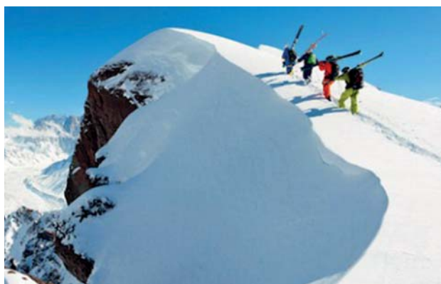
Turismo de aventura é o que não falta no Chile!