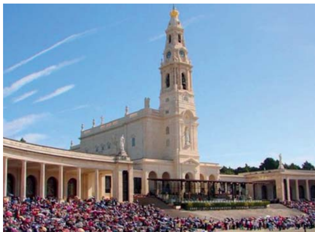
Fátima, Tomar e Batalha são as apostas de destino em Portugal

Brno (capital da Morávia), Olomouc e Lednice são algumas das cidades dramáticas do barroco está em evidência.