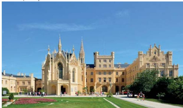
A República Checa espera receber grande número de turistas em Morávia

Morávia, situada a cerca de 200 quilômetros de Praga, é a grande aposta do turismo na República Tcheca. Eleito como tema de promoção para o próximo ano, o barroco se faz presente na região com inúmeros monumentos e edificações. Muitos deles nos levam de volta à época da reconstrução da localidade depois da Guerra dos Trinta Anos.