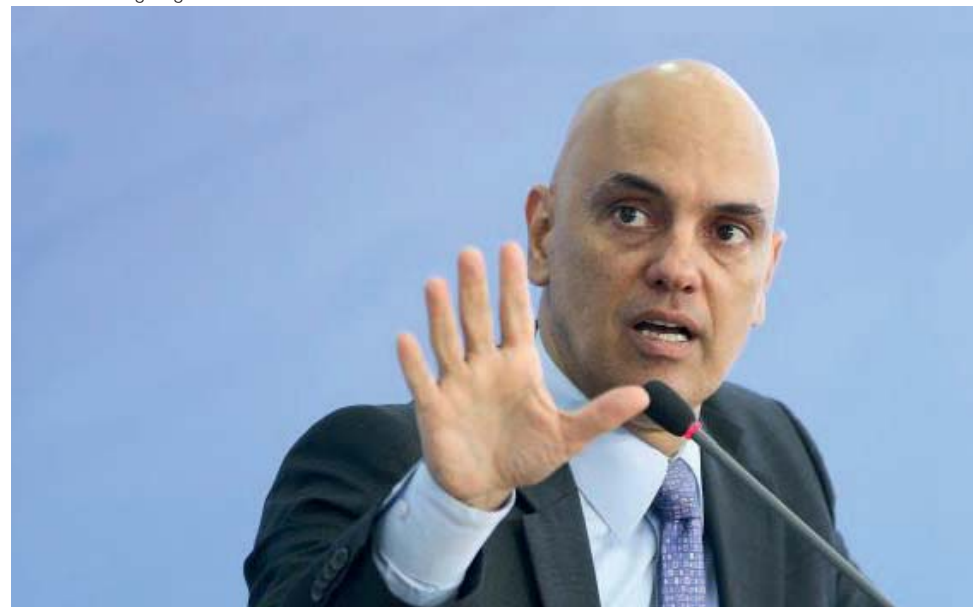
O ministro da Justiça e Cidadania, Alexandre de Moraes, apresenta detalhes do Plano Nacional de Segurança

O governo pretende reduzir em 7,5% o número anual de homicídios dolosos nas capitais do país em 2017