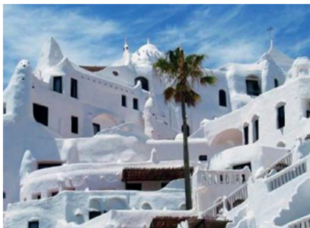
Que tal comemorar os 100 anos do tango em Punta del Este?